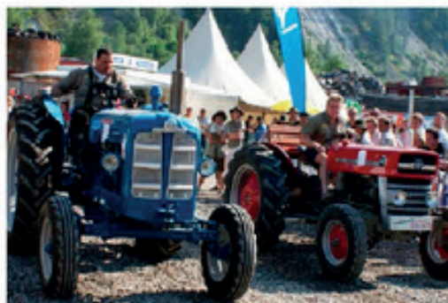
Zwei Oldtimer Traktoren beim Beschleunigungswettbewerb.