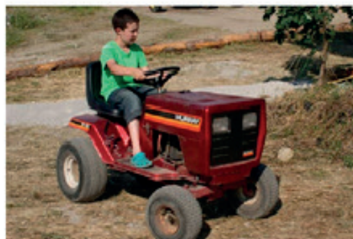
Ein Spaß für die Kinder – früh übt sich wer ein Meister werden will.