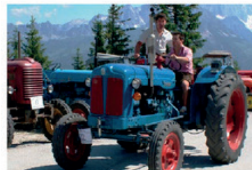
„Blauer Riese“: Das Ziel wurde erreicht.